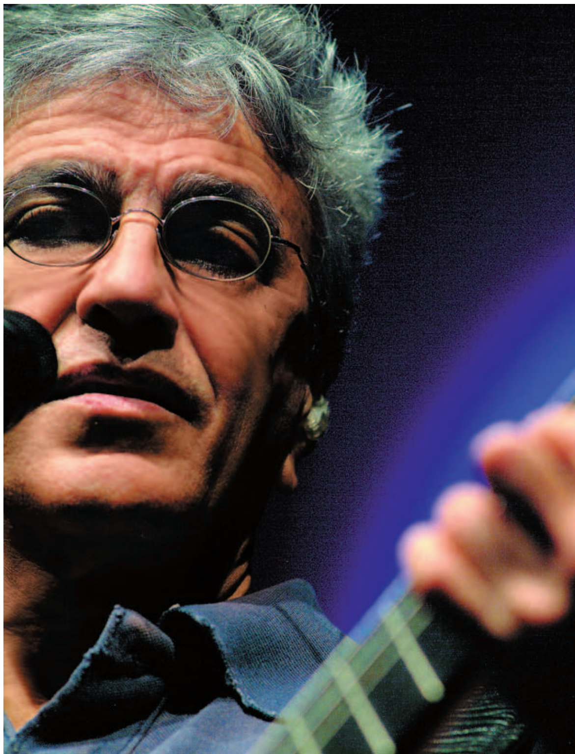
El músico brasileño Caetano Veloso, en una imagen de este año

A la edad en la que la mayoría de artistas se asientan o elaboran trabajos más tranquilos, usted da un giro rockero. ¿Por qué? Bueno, estoy en el rock desde el año 66. Tengo incluso discos de los 80 con algo de rock. Pero éste es mi disco más rockero porque es un disco de banda. Monté un grupo que participó en la creación. Y